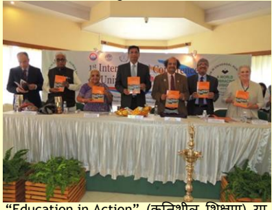
"Education in Action" (कृतिशील शिक्षण) या पुस्तकाचे प्रकाशन