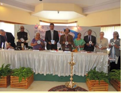
अकादमीचे गीताचे सी. डी.च्या माध्यमातून प्रकाशन