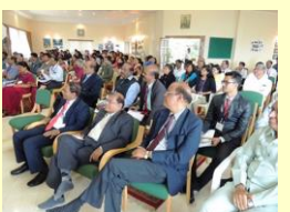
परिषदेतील काही सहभागी