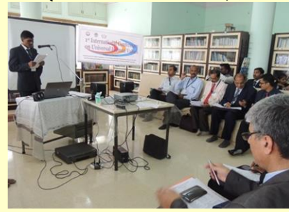
सुरभी कॉम्प्युटर चे विद्यार्थी सादरीकरण करतांना