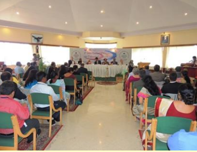
परिषद हॉल "ए"