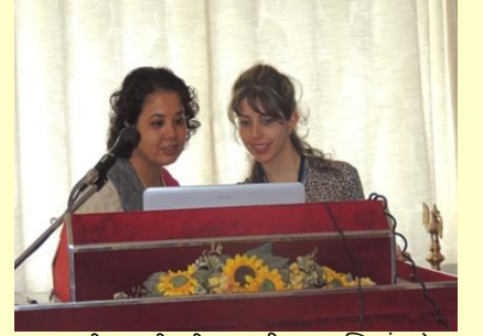
अकादमीच्या श्रीमती. सायली दु. आणि बंगलोर च्या कृ. शिवा ई. वैज्ञानिक सत्रात दरम्यान